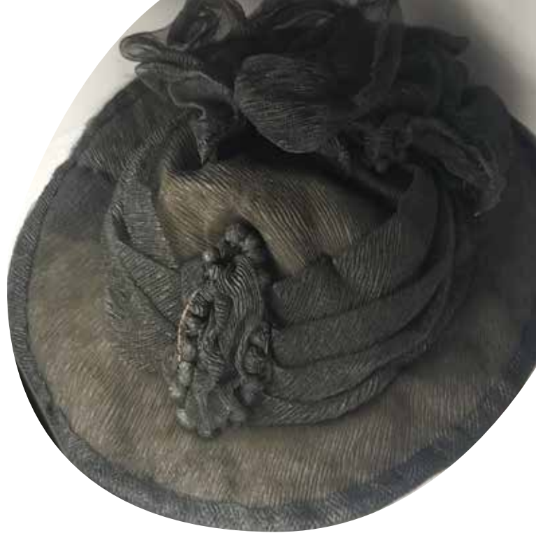
Objekte im Bestattungsmuseum: Schicke Trauermode und wo man sie herbekam – und wenn auch nur leihweise.

Was den schwarzen Humor betrifft, der quasi un- ausweichlich dazugehört: „Der Wiener lacht gerne über das, was er nicht ändern kann. Und was lässt sich weniger ändern als der Tod? Schwarzer Humor ist hier quasi das Schmiermittel, das die Zahnräder des Lebens – und des Sterbens – in Bewegung hält. Es ist eine Art, mit dem Unbe- hagen umzugehen, ohne sich dem Ernst des Themas zu entziehen.“