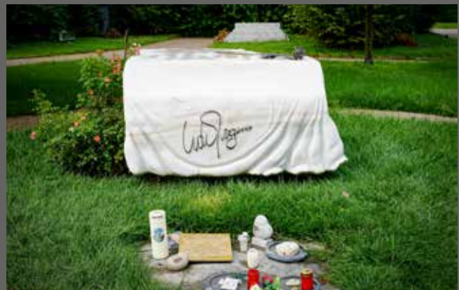
Das Ehrengrab von Udo Jürgens gehört zu den Besuchermagneten.