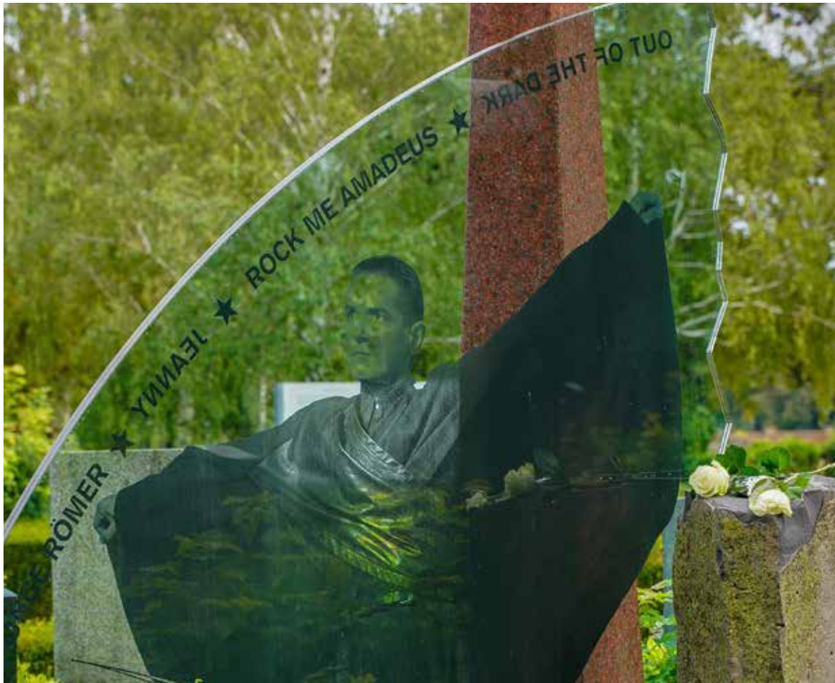
Bei Touristen beliebt: Das Ehrengrab von Falco.