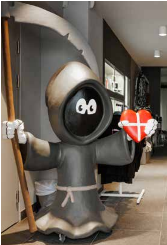
Der Quiqui ist das Maskottchen des Bestattungsmuseums.

wagen der Eisenbahngesellschaft – die Exponate verdeutlichen den pragmatischen, teilweise nüchternen Zugang früherer Generationen zum Tod und eröffnen zugleich einen unmittelbaren Blick auf historische Persönlichkeiten.