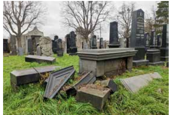
Im jüdischen Teil des Zentralfriedhofes wird Vergänglichkeit sichtbar.

Mein Besuch beginnt im Museum am Zentralfriedhof. Hier werde ich gleich vom Quiqui, dem herzigen Sensesmännchen und Maskottchen des Museums, in Empfang genommen. Das Bestattungsmuseum bietet einen umfassenden und unterhaltsamen Einblick in die Geschichte und Kultur des Todes in der österreichischen Hauptstadt. Schnell spürt man, dass es hier um weit mehr als eine Sammlung historischer Objekte geht: Es dokumentiert den ganz besonderen