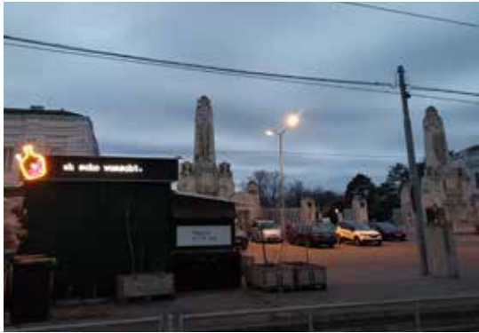
Die Würstchenbude am Tor 2, dem Haupteingang: Eh scho Wuascht!

Sonnenbrillen da. Oder Flaschen mit Hochprozentigem. Er gehört untrennbar zum Klischee des typisch Wienerischen: der Zentralfriedhof. Er ist so groß, dass man, gegen Gebühr, mit dem Auto darin zu einer Grabstelle fahren darf. Er ist eine Stadt in der Stadt, mit vielen Bezirken und Vierteln, mit zentralen Plätzen, mit Stein und Natur, mit breiten Alleen und schmalen Pfaden, mit Menschen und Tieren, mit Touristen und Trauernden. Mit schiefwinkligen Grabkreuzen, wunderschönen Grabstellen, mit unfassbarem Pomp, mit Kunst und manchmal eben auch Kitsch. Um das Phänomen Zentralfriedhof genauer zu erkunden, bin ich im November 2025 wieder nach Wien gefahren. Ich habe mich per E-Mail für eine Führung angemeldet. Man freue sich, schreibt der nette Mitarbeiter in seiner Antwort, und: „Das wird ein Spaß!“