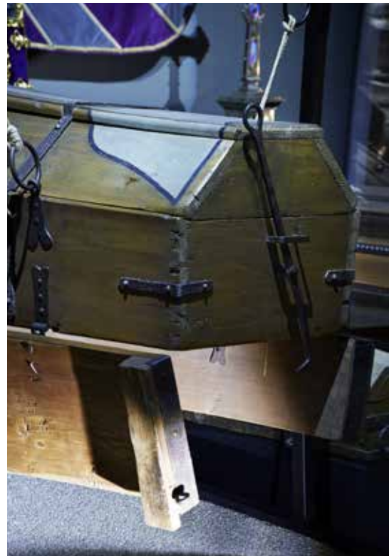
Hier wurde gespart und ein Sarg gleich mehrmals verwendet!

Dann beginnt auch schon die Friedhofsführung für die österreichische Gruppe, der ich mich angeschlossen hatte. Der Wiener Zentralfriedhof ist als einer der größten Friedhöfe Europas nicht nur Begräbnisstätte, sondern auch historischer und kultureller Erinnerungsraum. Die Führung – gespickt mit Sachverstand und Wiener Schmä