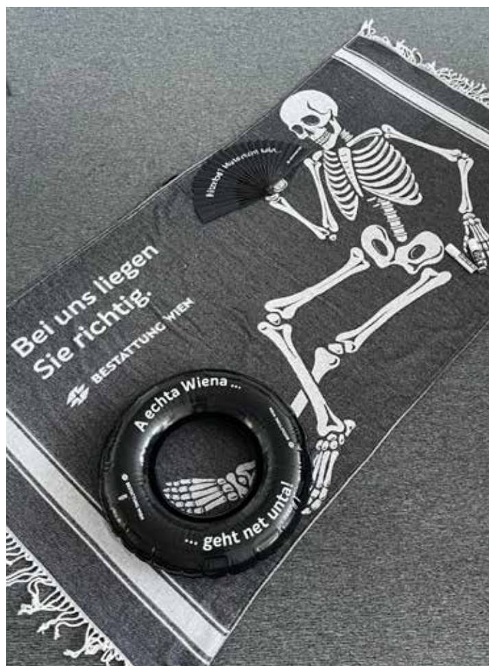
Schwarz ist bunt genug für Zentralfriedhof-Fans. Auch beim Baden!

Weil sich hier Geschichte, Kultur und Mentalität der Stadt auf einzigartige Weise verbinden. Der Zentralfriedhof ist weit mehr als ein Begräbnisplatz, er ist ein offenes Geschichtsbuch. Die Grabanlagen und Ehrengräber berühmter Persönlichkeiten aus Kunst, Kultur und Politik erzählen von der Entwicklung Wiens von der Zeit der Habsburgermonarchie bis heute. In den Ehrengräbern ruhen weltberühmte Namen wie Johann Strauss Vater und Sohn, Ludwig van Beethoven, Franz Schubert, Johannes Brahms, Falco oder Udo Jürgens. Ihre Gräber machen deutlich, wie sehr Wien seine Persönlichkeiten über den Tod hinaus ehrt. Die Vielfalt an Grabmälern spiegelt auch gesell-