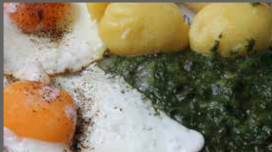
Zusammen mit Kartoffeln und Eiern ist Wildkräuterspinat eine gesunde Variante des klassischen Gründonnerstagsessens in Franken.

Nur feingehackt und nicht püriert kann der Spinat nach dem kurzen Blanchieren zusammen mit einer Zwiebel, als Fülle für Pfannkuchen oder in Lasagne verwendet werden.