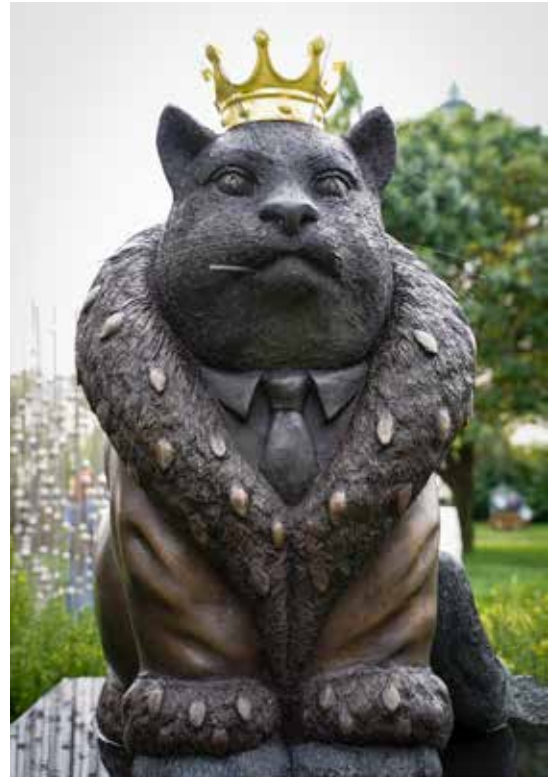
Die Grabfigur des Karikaturisten Manfred Deix (gest. 2016).

Sie bezieht sich auf eine seiner Zeichnungen mit dem Titel „Katzenkönig“. In seinem St. Pöltner Zuhause habe der im Jahr 2016 verstorbene Künstler zeitweise bis zu 80 Katzen um sich geschart, heißt es. Auch die rosarote Grab-Plastik für den 2012 verstorbenen Wiener Künstler Franz West fällt unweigerlich sofort ins Auge. Moderne Kunst und Erinnerungskultur – wer