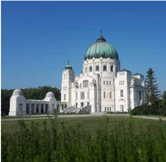
Jugendstil auf dem Zentralfriedhof: Die Karl-Borromäus-Kirche.

Wiens verbunden ist. Auf Schritt und Tritt großes Kino, könnte man sagen. Beethoven, Schubert und Brahms können hier besucht werden, außerdem Udo Jürgens oder das Grab von Arthur Schnitzler.